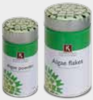
Algae powder Algae flakes Umami