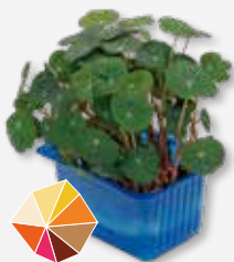
Zorri Cress Picante, rábano