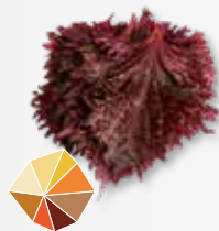
Shiso Leaves Purple