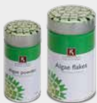
Algae powder Algae flakes Umami