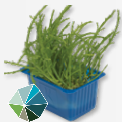
Salicornia Cress Salgado, crocante