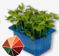
Tahoon® Cress Nozes de faia, cogumelos, trufas