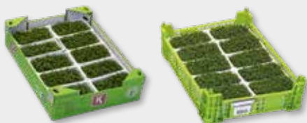
Agrião de jardim