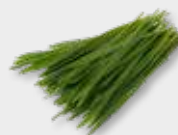
Wheat Grass 3)