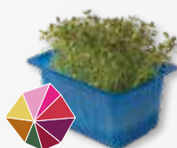
Time Cress Tomilho ligeiramente amargo