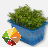
Garden Cress 3)