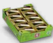
Agrião de jardim

(10x SinglePack) Mostarda, picante, rabanete