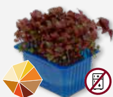
Shiso Purple Cominho, fresco