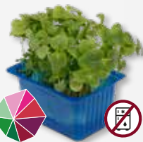
Shiso Green Menta, anis