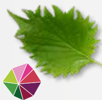
Shiso Leaves Green