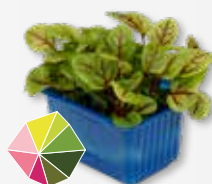
Vene Cress Ligeiramente ácido