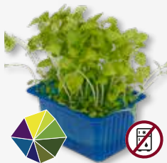
Sechuan Cress® Formigueiro, eléctrico, entorpecido