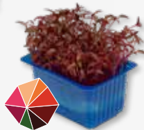
Scarlet Cress Beterraba suave