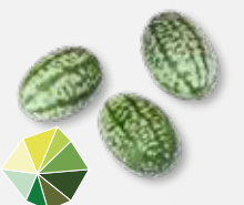
Pepquiño® frischer, leichtsaurer Gurken 1)