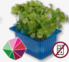
Shiso Green Minze, Anis