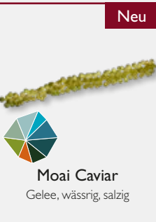
Moai Caviar Gelee, wässrig, salzig