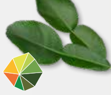
Kaffir Lime Leaves süße Zitrusfrüchte, Limette