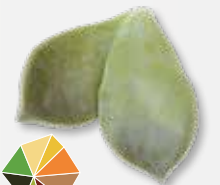
Maji® Leaves saftig und knackige Blätter