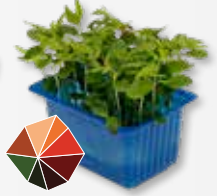
Tahoon® Cress Bucheckern, Pilz, Trüffel