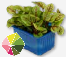
Vene Cress leicht säuerlich