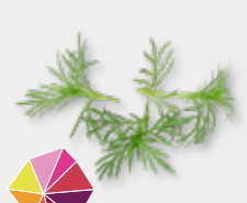
Patzizz Tops® süß, Anis