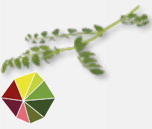
Hummus Leaves Kichererbse