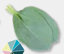
Oyster Leaves Sole, Auster