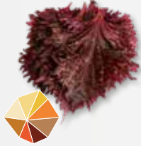
Shiso Leaves Purple