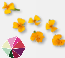
Anise Blossom Anis, Estragon