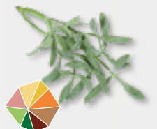
Sea Fennel aromatisch, würzig, Spargel