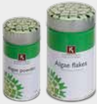
Algae powder Algae flakes Umami