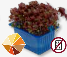
Shiso Purple frischer Kreuzkümmel