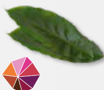
Cardamom Leaves Zimt, holzig, leicht süßlich