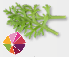
Kikuna® Leaves Möhre, Sellerie