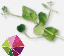
Salad Pea sehr feiner Erbsengeschmack