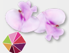
Bean Blossom frische Bohnen