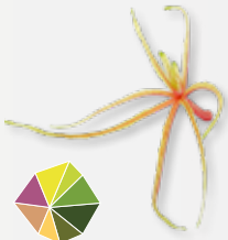
Aikiba® Leaves Gallertartig, leicht süß-säuerlich