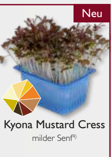
Kyona Mustard Cress