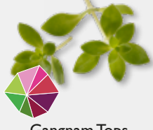
Gangnam Tops frisch, leicht bitter