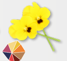
Cornabria Blossom® frischer Frühlingsgeschmack