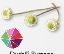
Dushi® Buttons süß, Minze, Thymian, süßer als Zucker