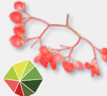
Apple Blossom säuerlich, grüner Apfel