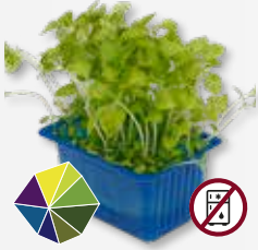
Sechuan Cress® prickelnd, elektrisch, leicht betäubend