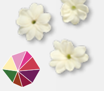
Jasmine Blossom aromatisch, Jasmin