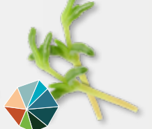
Salty Fingers® Sole, knackig, leicht bitter