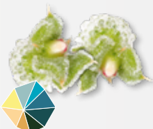
BlinQ Blossom® frisch, Sole, Salz