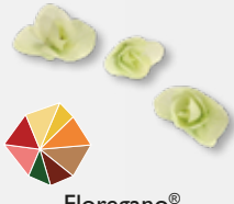
Floremano® Oregano, sommerlich