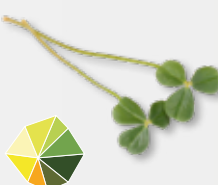
Citra Leaves® frischsäuerliche Zitrusnoten