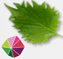
Shiso Leaves Green