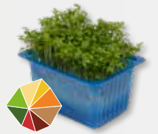
Garden Cress 2)