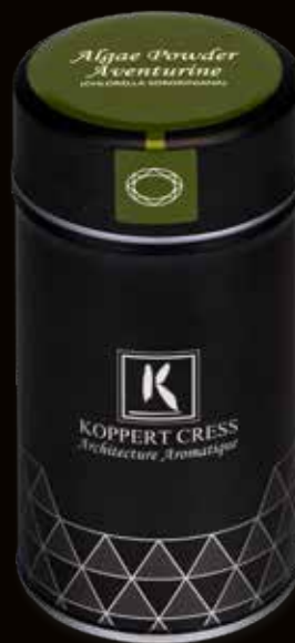
Algae Powder Aventurine (Chlorella Sorokiniana)

Il a été prouvé que les algues sont présentes sur la planète depuis plus de deux milliards d'années, ce qui les rend essentielles à l'écosystème de la planète. Les Aztèques sont le peuple le plus ancien à avoir consommé des algues. Les conquistadors espagnols ont vu les peuples indigènes sortir une bouillie bleu-vert de l'eau, qu'ils laissaient ensuite sécher au soleil avant de la consommer et ainsi profiter de sa source de chlorophylle importante (feuille verte) et de sa teneur élevée (> 60 %) en protéines, vitamines, oligoéléments et acides gras Oméga 3.