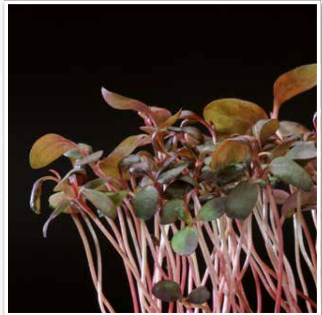
Adj Cress (Persicaria)

Adj Cress est une plante qui trouve son origine en Asie orientale, notamment au Japon, en Corée du Sud et en Chine. Au Japon, c'est depuis toujours un mets délicat servi avec du poisson gras. Utilisées comme légume, les feuilles étaient, dans la médecine traditionnelle, un remède aux prétendues vertus rafraîchissantes et coagulantes. En attendant une enquête plus approfondie.